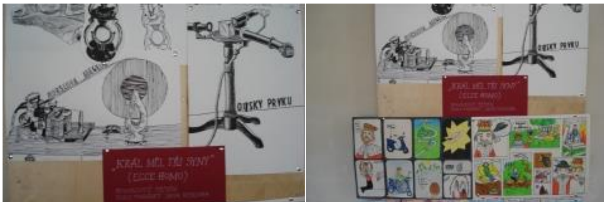
(Člověk- vynálezce a tvůrce).

Vystavená díla jsou k vidění v Klášteře Zásmyky od 17. února 2018.