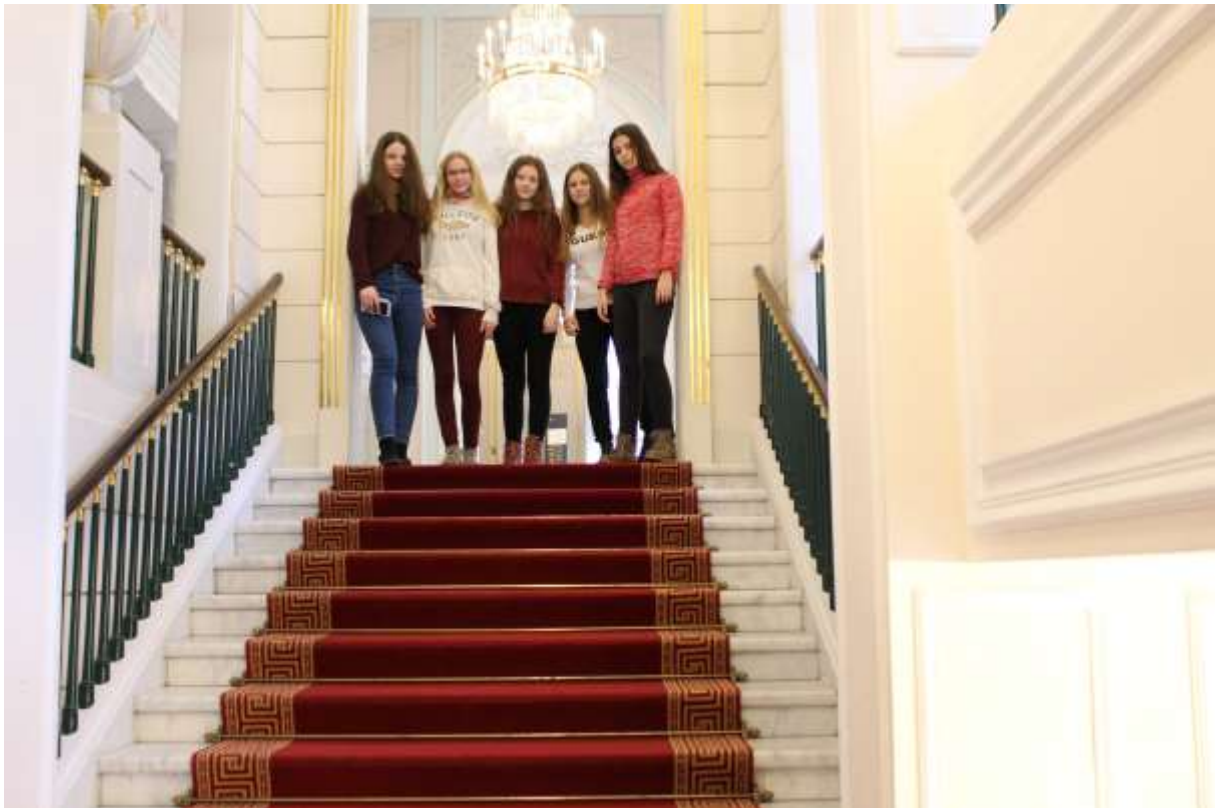
Vídeň nás opět nezklamala!